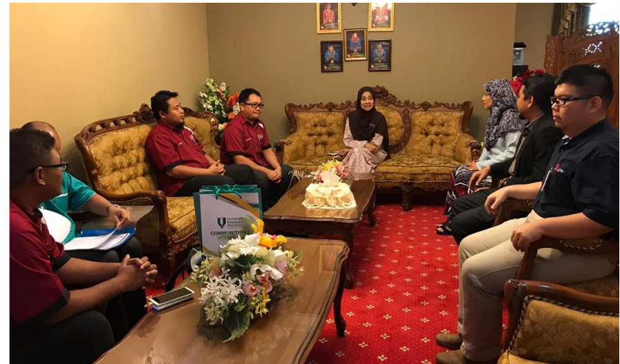
Lampiran 40: Lawatan Universiti Malaysia Pahang ke JKM