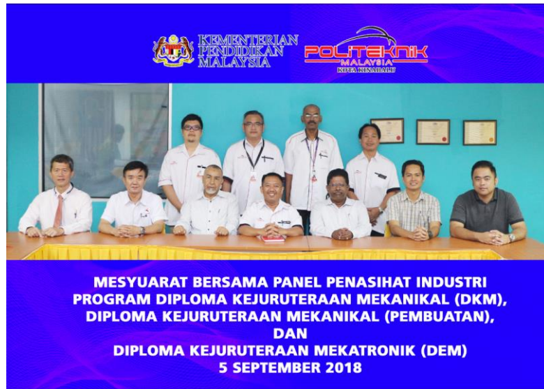
Lampiran 30: Mesyuarat Panel Penasihat Industri JKM