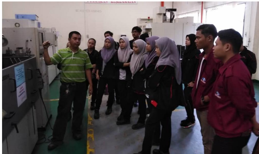
Lampiran 39: Lawatan Pelajar JKM ke Makmal CNC ILP KK