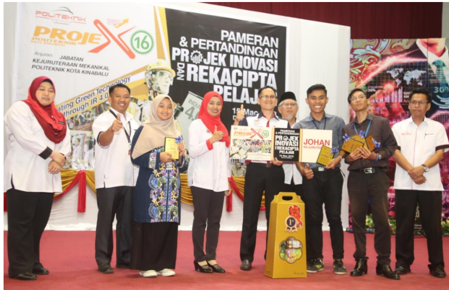
Lampiran 5: PROJEX 16 Anjuran JKM Sesi Dis 2017