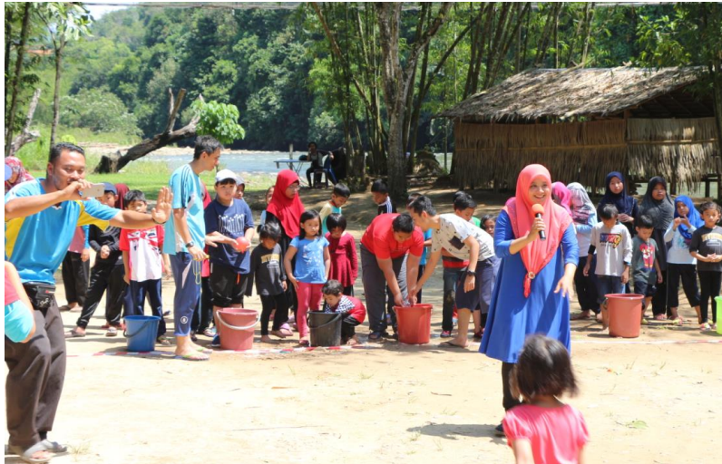
Lampiran 14: Family Day JKM 2018