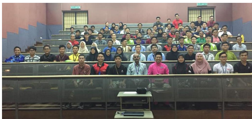
Lampiran 23: Mesyuarat Agung Kelab Mekatronik

Kepada : JKA, JKE, JKM, JP & JPH Daripada : Ketua Unit Perhubungan Dan Latihan Industri Salinan Kepada : Fail Tarikh : 6 Julai 2018 Ruj. Fail : PKK/UPLI/01/02 Jld. 1 (99)