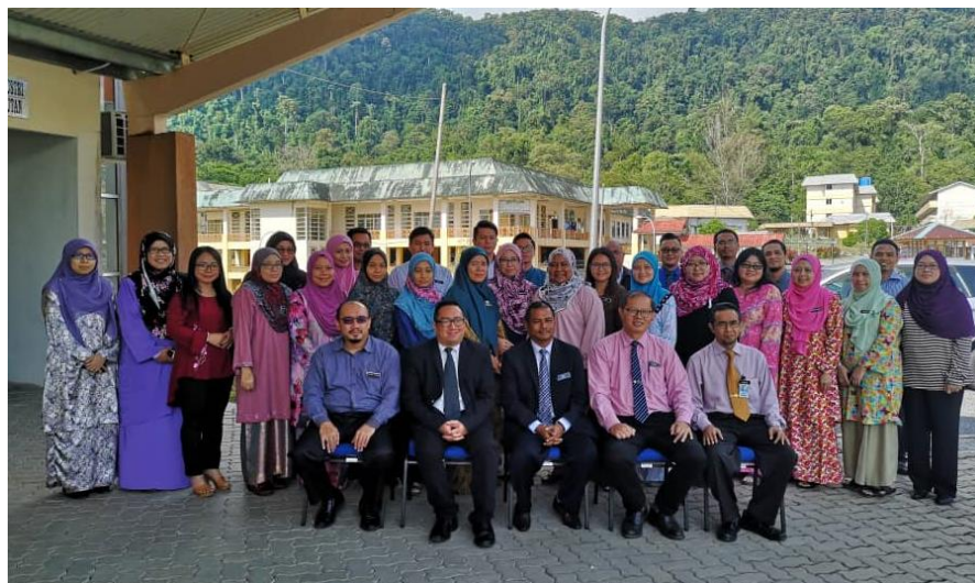
Lampiran 45: Kursus Educator 4.0 Zon Borneo Politeknik Kuching