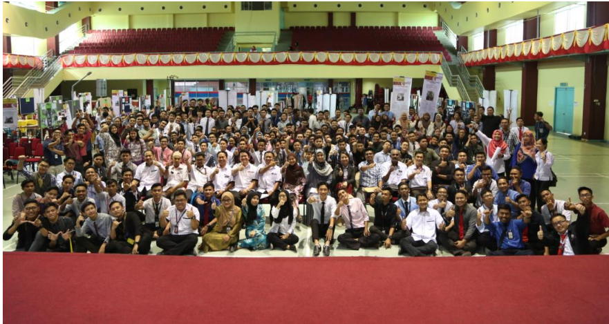
Lampiran 34: MIEX Sesi Jun 2018