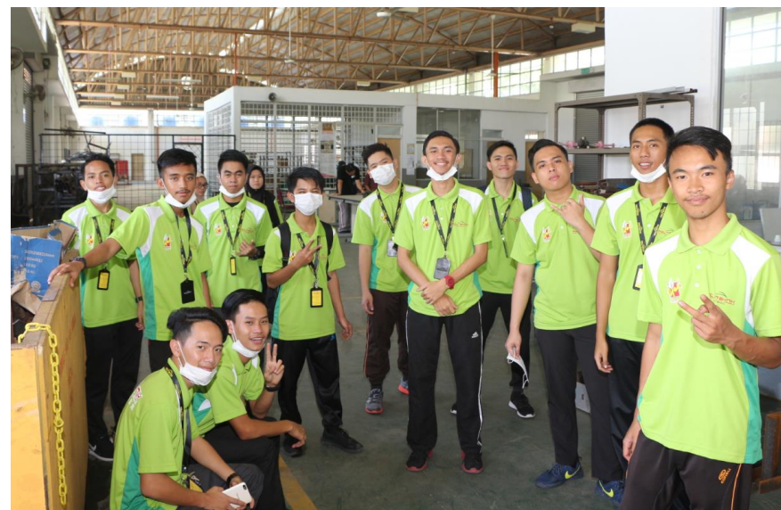
Lampiran 51: Program EKSA JK 2018