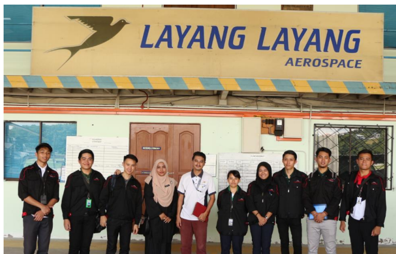
Lampiran 2: Lawatan Pelajar DEM ke Layang-layang Aerospace Academy