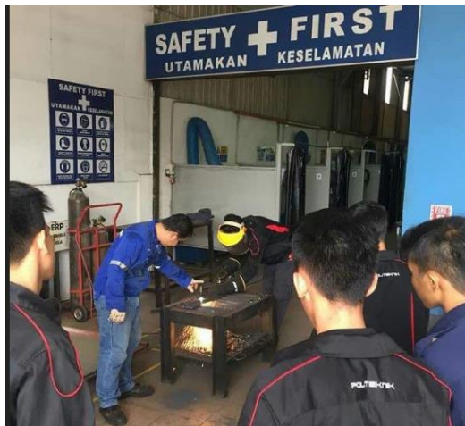
Lampiran 11: Kursus Kimpalan 3G SMAW di TWI