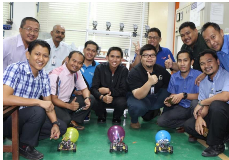
Lamp 3: Kursus Internet of Things Staf JKM