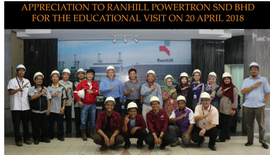
Lampiran 12: Lawatan Staf JKM ke Ranhill Powertron