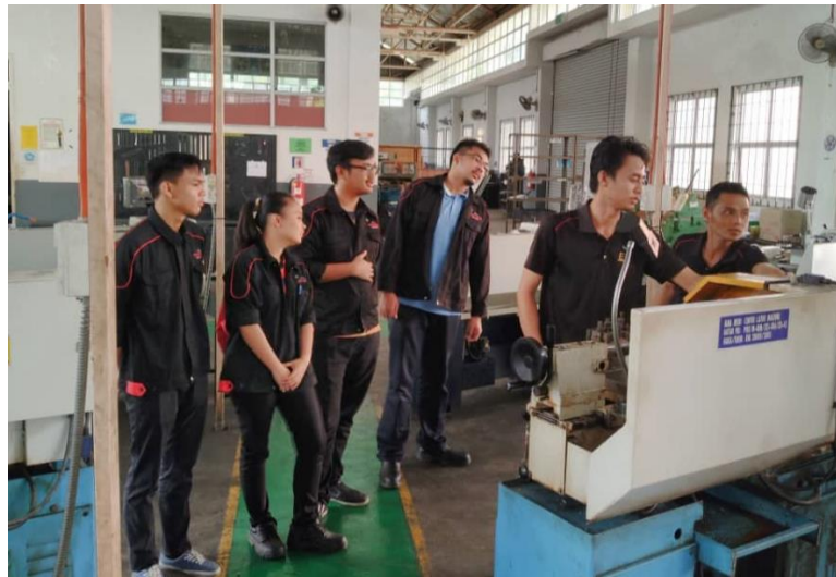
Lampiran 38: Program Penyelenggaraan Mesin Larik