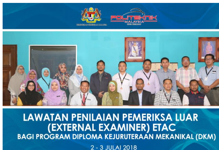
Lampiran 19: Lawatan ETAC bagi Program DKM