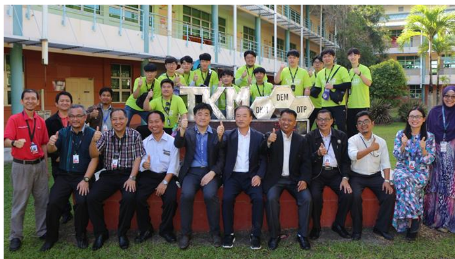
Lampiran 50: Lawatan Rombongan Politeknik Korea ke JKM