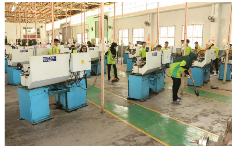
Lampiran 29: Gotong-royong Bengkel Mesin