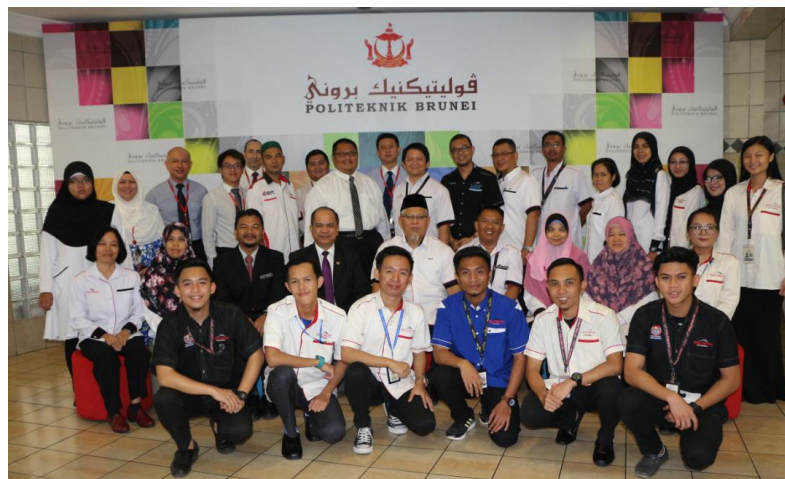
Lampiran 31: Intellectual Trip To Politeknik Brunei