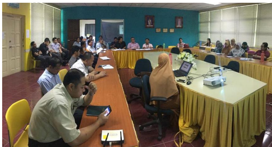
Lampiran 20: Mesyuarat JKM Bil 1 2018