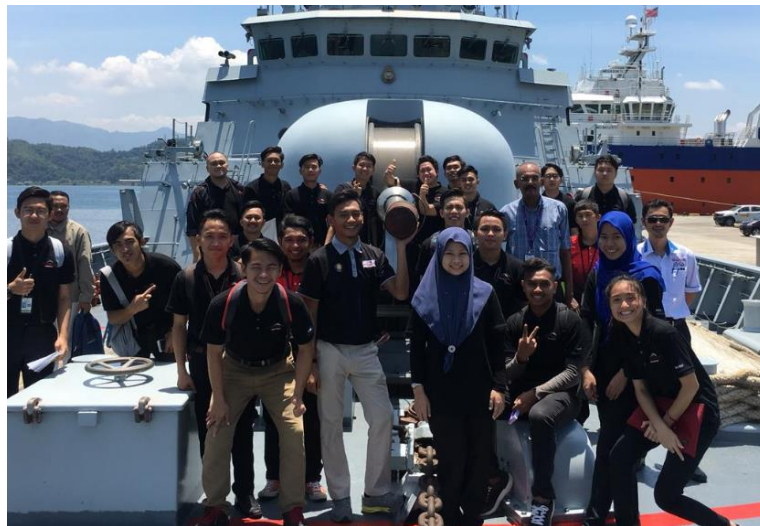
Lampiran 35: Lawatan Kelab Mekatronik ke TLDM Sepangar