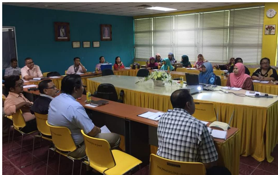
Lampiran 25: Taklimat ISO dan GP Pengurusan PnP JKM