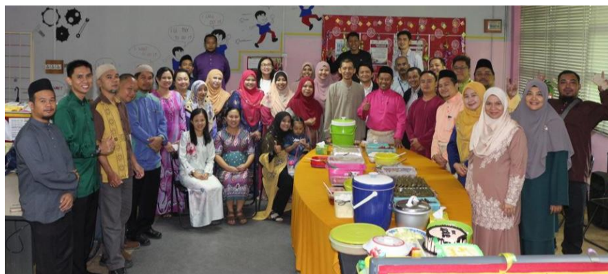
Lampiran 22: Majlis Sambutan Hari Raya Aidilfitri JKM 2018