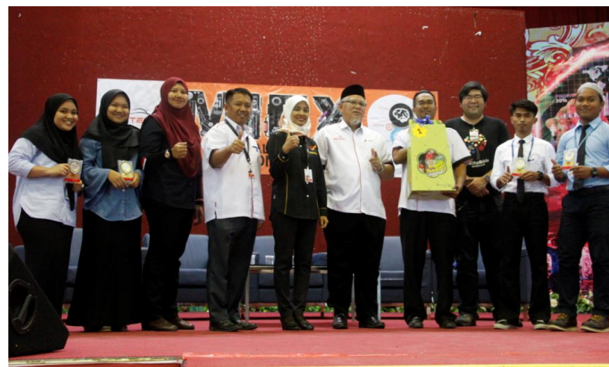
Lampiran 4: MIEX Sesi Dis 2017