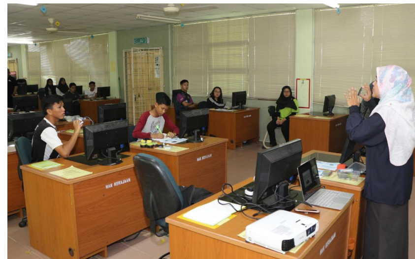
Lampiran 48: CSR PSH DEM Kursus Asas Robotik