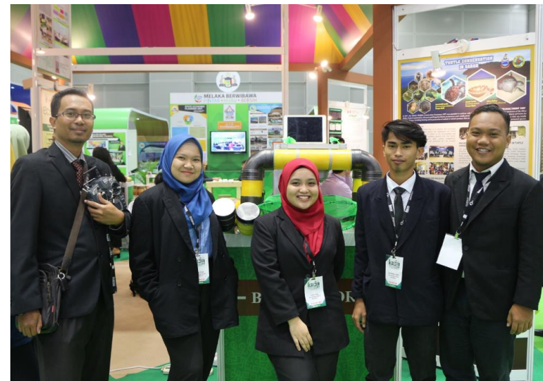
Lampiran 37: IGEM KLCC 2018 Projek RCFTC JKM