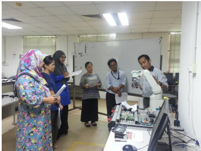
Lampiran 15: Bengkel Pemantapan PnP DJF6081