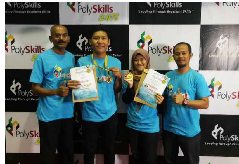
Lampiran 33: JKM PKK Johan Poliskill 2018 Kategori Mekatronik