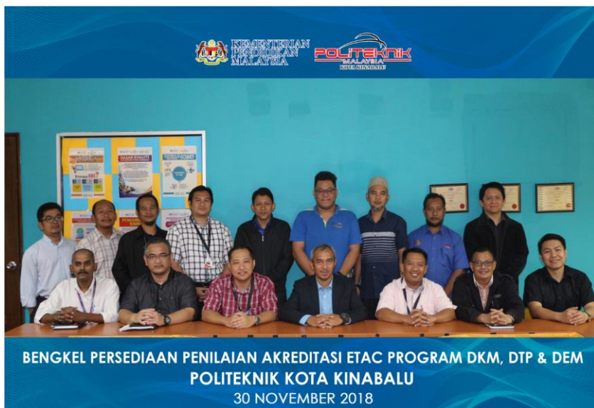
Lampiran 49: Taklimat Persediaan Akreditasi ETAC JKM