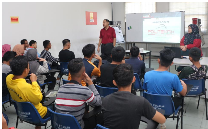
Lampiran 46: CSR PSH DKM Kursus Asas Kimpalan Arka