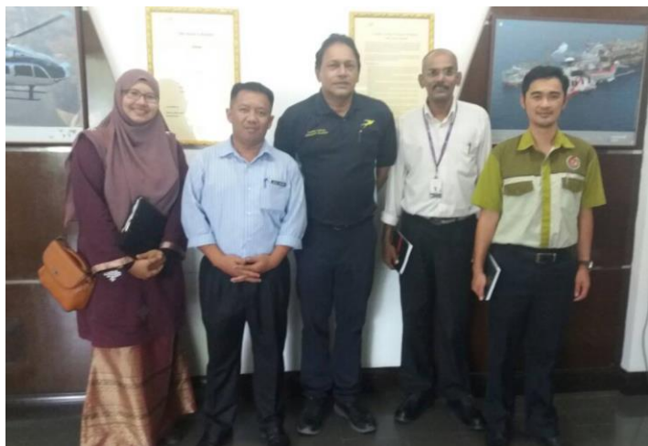
Lampiran 1: Lawatan Muhibah JKM ke Layang-layang Aerospace Academy