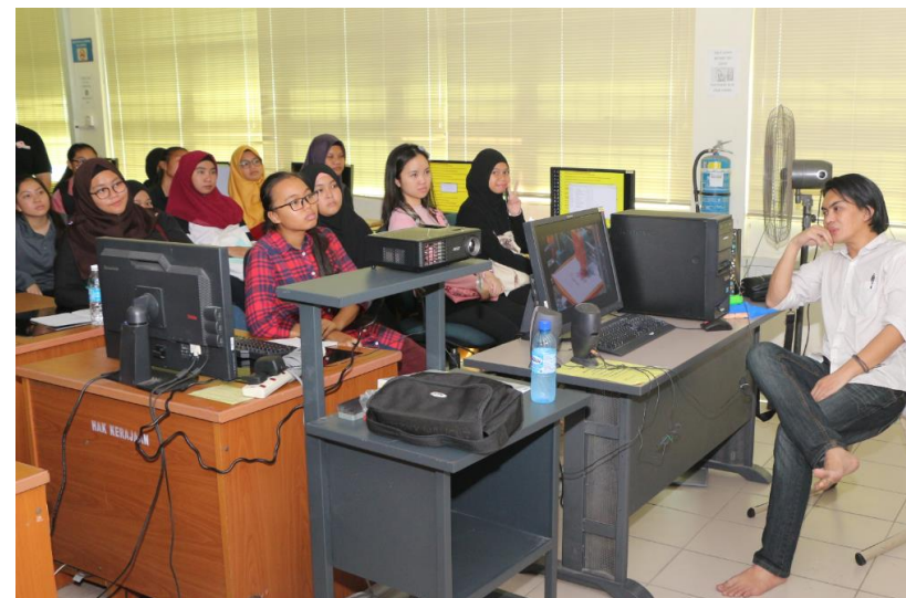
Lampiran 47: CSR PSH DTP Kursus 3D Printer