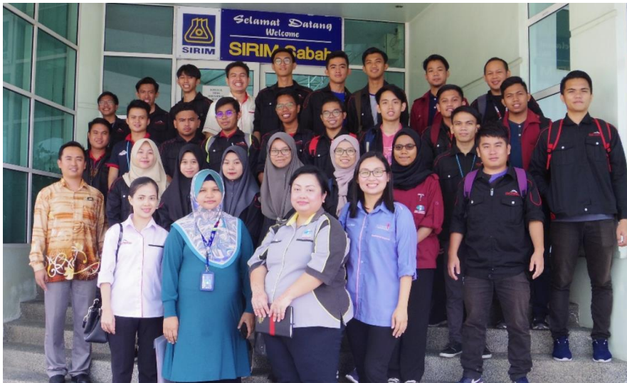
Lampiran 10: Lawatan Pelajar DTP ke SIRIM Kota Kinabalu