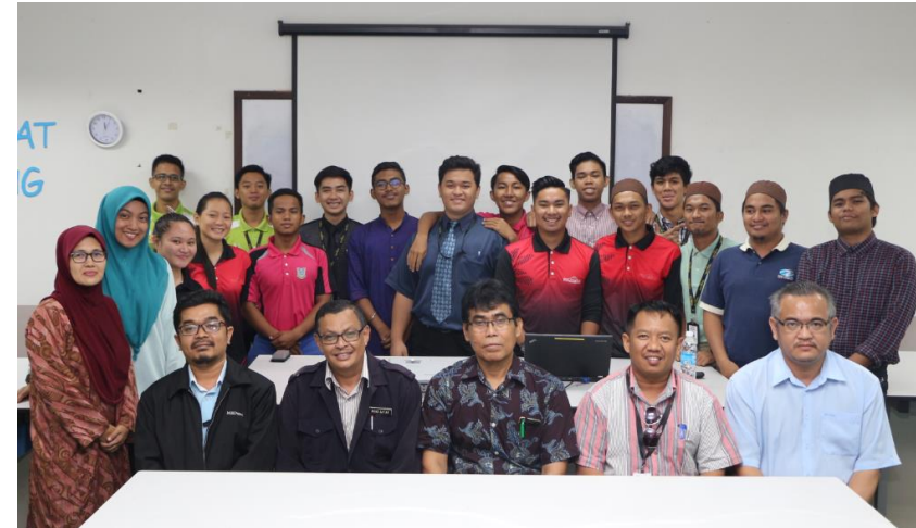
Lampiran 36: Perkongsian Ilmu JKM PKK dan POLMED