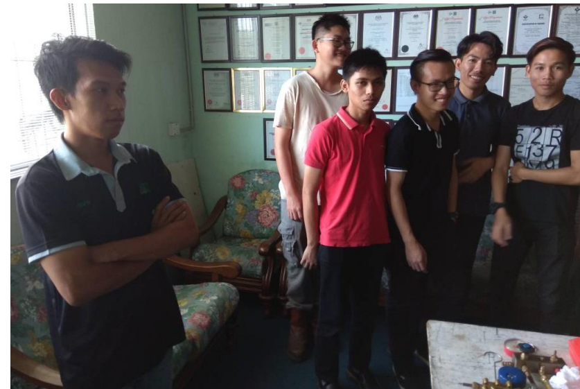
Lampiran 13: Kursus Aircond CIDB